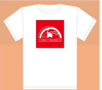
2023 オリジナルTシャツ